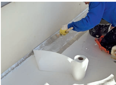
Die Details wie Wandanschlüsse dichteten die Fachverleger vliesarmiert mit Wecryl R 230 thix ab.