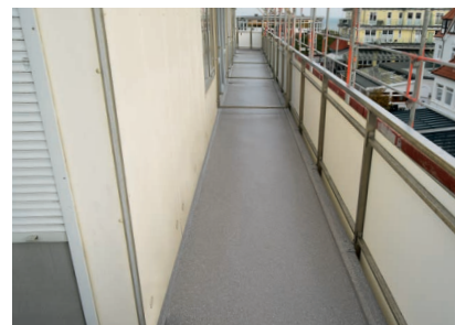
Die langlebige PMMA-Beschichtung passt sich harmonisch dem Stil des Hauses an und hält den maritimen Witterungsbedingungen stand.