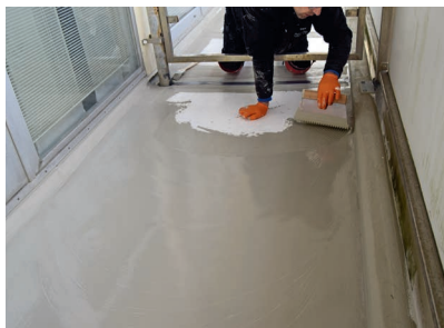
Der Verlaufmörtel Wecryl 233 wurde anschließend als Schutzschicht sorgfältig mit der Aufstreichkelle mit Dreieckzahnleiste appliziert.