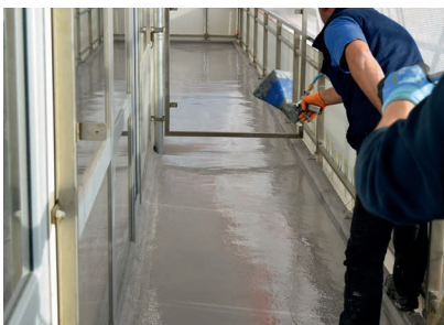
Die in die noch frische Oberflächenversiegelung eingestreuten Chips sorgen nicht nur für eine ansprechende Optik, sie erhöhen zudem die Rutschfestigkeit auf den Balkonen.