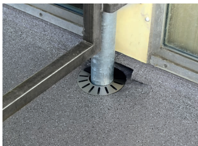
Komplexe Details, Durchdringungen, Aufkantungungen und Fugen wurden naht- und fugenlos dauerhaft abgedichtet.