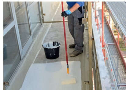
Der geschliffene und gereinigte Betonuntergrund wurde mit Wecryl 276 grundiert. Danach wurden vorhandene Ausbrüche mit dem Reparatur- und Ausgleichsmörtel Wecryl 242 reprofiliert.