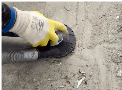
Alle losen und haftungsmindernden Bestandteile wurden durch die sorgfältige Untergrundbehandlung fachgerecht entfernt.