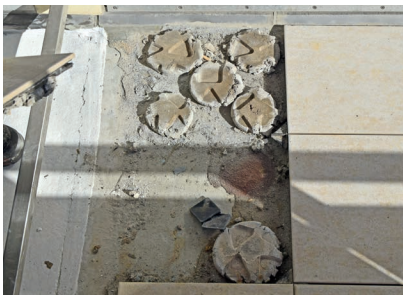
Unter den Balkon-Fliesen zeigten sich gravierende Beschädigungen: Der Betonuntergrund wies Hohlstellen und Risse auf.

nach einer langlebigen und zugleich stilvollen Beschichtung spielte bei der Auftragsvergabe eine ebenso große Rolle wie eine Sanierung in den kalten Monaten. Die Verwendung eines Systemaufbaus auf PMMA-Basis und eine rasche Ausführung des Verarbeiters waren dafür ausschlaggebend, dass diesem Wunsch entsprochen werden konnte. So konnte die Ferienvermietung zu den Hauptsaisonzeiten weiterhin uneingeschränkt erfolgen.